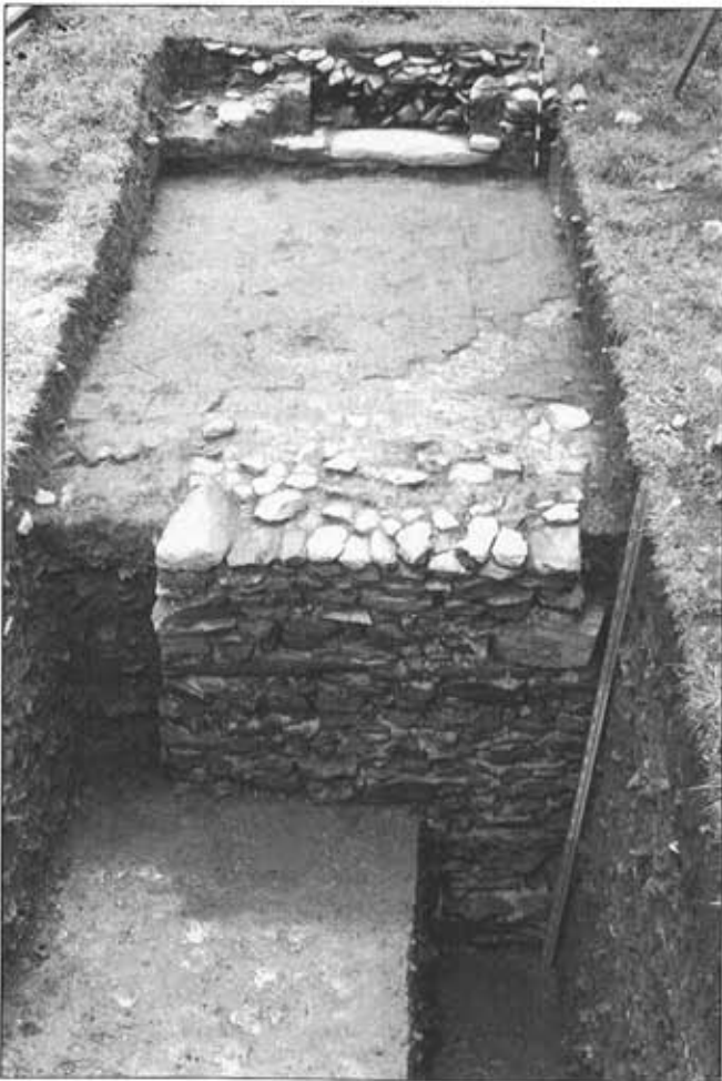
Lámina 2.-Vista general del deambulatorio y su pavimentación. También, podemos ver el pilar que sustentó las arcadas del claustro de época moderna.

A los pies del vano de ingreso a la nave central del templo se excavó un sondeo cuyo objetivo no era otro que buscar el nivel original y los restos que pudiesen conservarse del pavimento antiguo del Campo de la Iglesia. En dicho sondeo, de 4 m 2 de superficie y 0,9 m de profundidad, no se recuperaron materiales arqueológicos, documentándose únicamente dos de los escalones de ingreso al templo y restos muy mal conservados del primitivo pavimento, compuesto por lajas de pizarra de pequeño tamaño y mortero de cal y arena. La estratigrafía tampoco resultó demasiado interesante, presentando dos niveles entre los que se intercalan sendos estratos compuestos por tejas muy fragmentadas que obede-